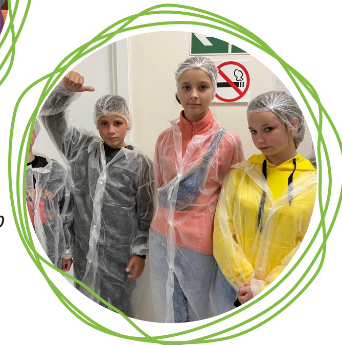
Экскурсия в сортировочный центр «Почты России»