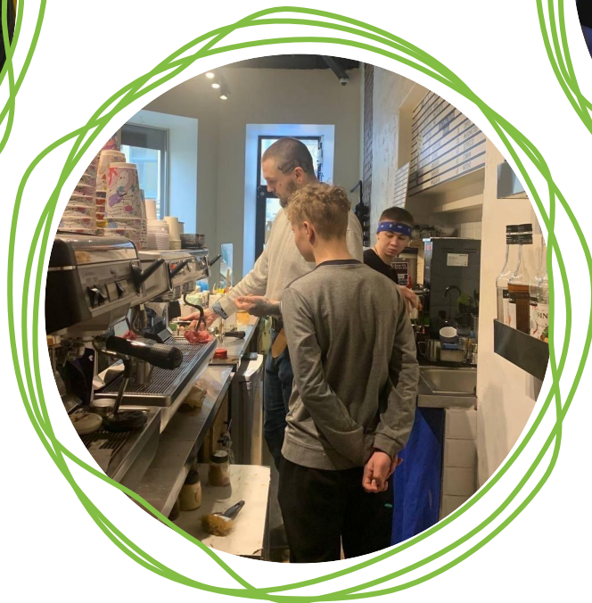
Кулинарный мастер-класс с бренд-шефом компании «Черкизово»