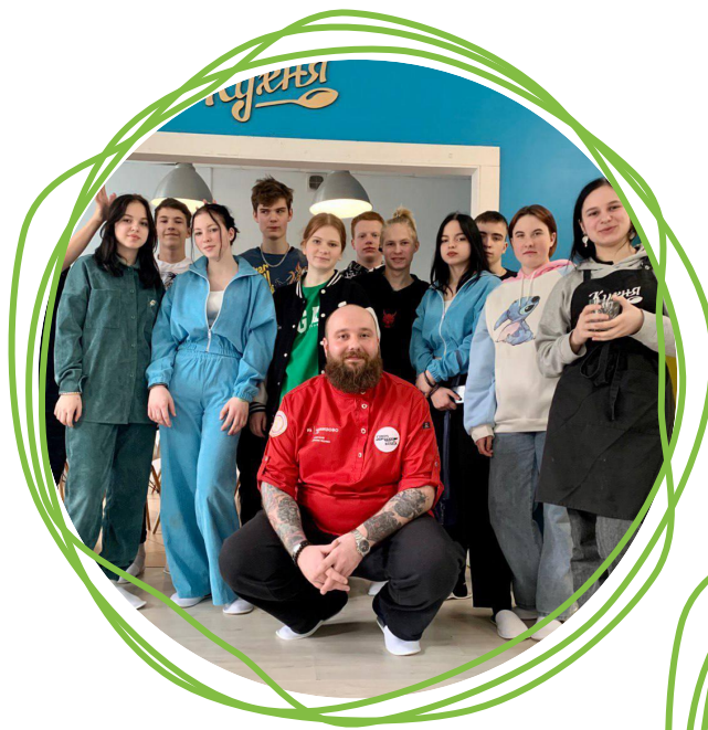
Экскурсия на рабочее место бариста в кофейне «В объятиях»