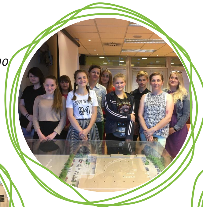
Экскурсия на производство комбината корпоративного питания iFCM Group